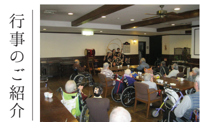
「太鼓ボランティア来荘」

2月14日に、小牧市で活動されている太鼓のグループ「鼓珀」の皆さんが来荘され、迫力のある太鼓を披露していただきました。お子さんから大人の方まで沢山の方にお越しいただき、黒い衣装を身にまとった鼓珀の皆さんが登場すると、ご利用者様からは、「あれはどこの太鼓だね?」などとスタッフに尋ねられる方もみえました。横笛による「村祭り」の演奏が始まると、生の太鼓の演奏に聞き入ってみえました。大きな太鼓の迫力のある演奏は、あっという間に終わってしまい、残念そうにされる方もみえましたが、普段は中々聞くことのできない太鼓の演奏に満足されているようでした。